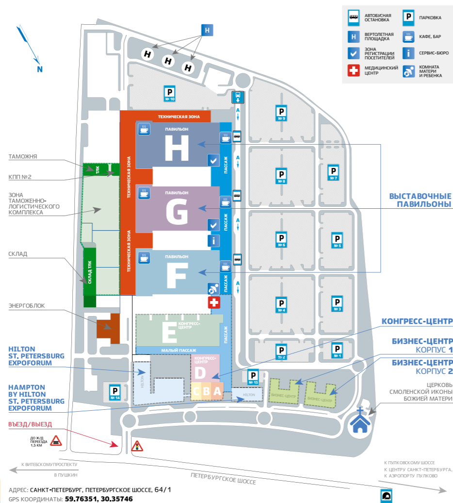
СХЕМА РАСПОЛОЖЕНИЯ И ТРАНСПОРТНАЯ ДОСТУПНОСТЬ

КОНГРЕССНО-ВЫСТАВОЧНЫЙ ЦЕНТР «ЭКСПОФОРУМ» РАСПОЛОЖЕН НА ПУЛКОВСКИХ ВЫСОТАХ